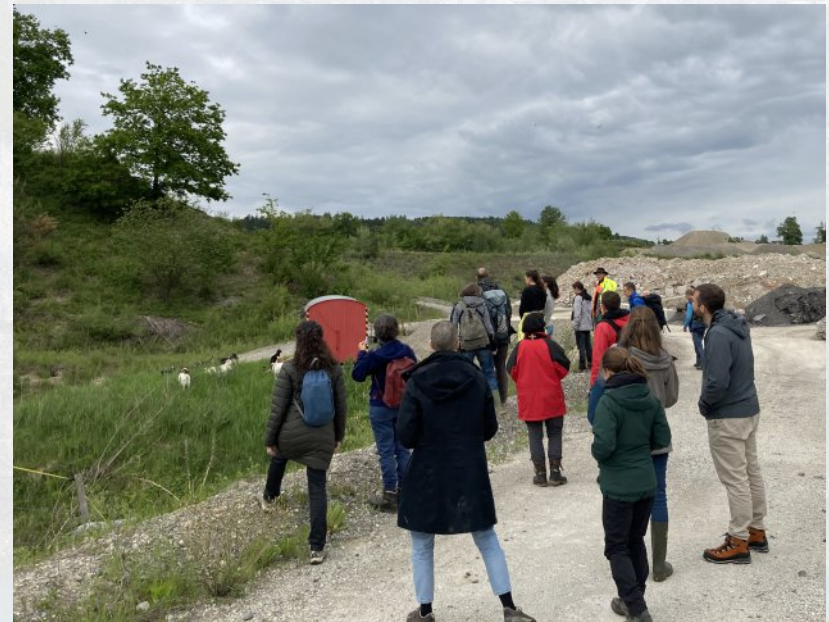
Auf der Exkursion für Gönnerinnen und Gönner

Im Vorfeld der Trinkwasser- und Pestizid-Initiative im Juni wurden Dossiers zu diesen Themen erarbeitet. Verschiedene Artikel beleuchteten die Initiativen und erläuterten, wieso ein zweifaches Ja aus Umweltsicht wichtig gewesen wäre.