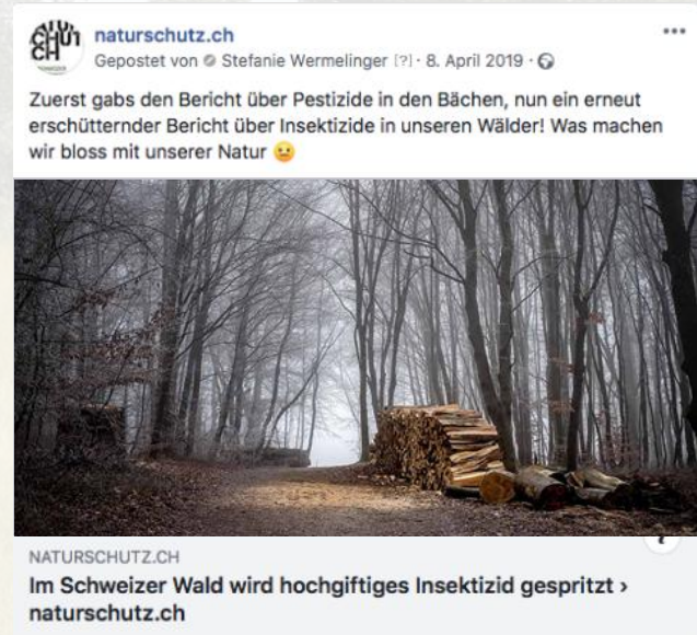
Facebook-Post mit grösster Reichweite 2019.